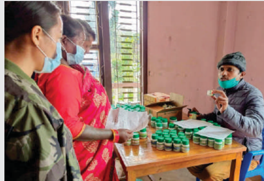
निःशुल्क आयुर्वेदिक शिविरमा औषधी वितरण