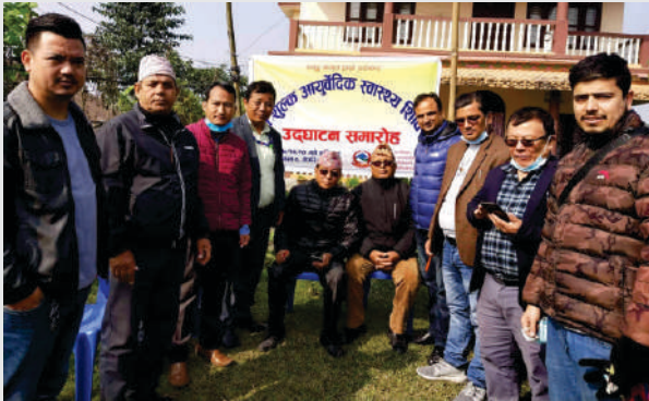
निःशुल्क आयुर्वेदिक शिविर उदघाटन समारोह