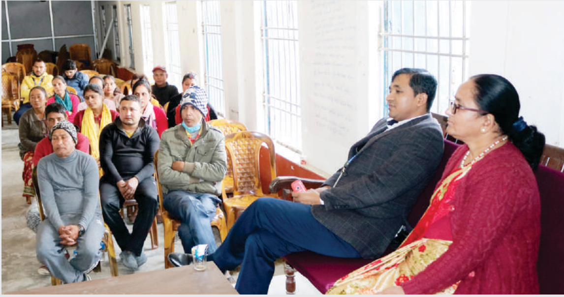
प्रधानमन्त्री स्वरोजगार कार्यक्रम शुभारम्भ